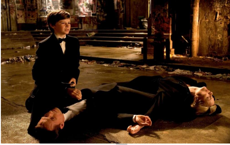
Görsel 1. Bruce Wayne, ailesinin cansız bedenlerinin başında oturmakta.

Bruce, ailesinin öldürülmesinin ardındaki adaletsizliği bozmak ister ancak içgüdüsel olarak bu çağrıyı reddeder. Bunun ana nedeni, Gotham şehrinin burjuva kesimini-Wayne ailesi dahil, yoksul kesim ile bıçak gibi ayırmasıdır. Şayet bu sunum, ailesinin öldürüldüğü opera salonunun arka çıkışıyla doğrudan ilişkilidir. Arka kapının geri olanı, burjuva olmayı temsil etmesi de buna örnek teşkil etmektedir. Işıklar içerisinde her yerin gösterişli olduğu burjuva salonundan sokağa adım attıklarında, arka sokakların ıssız ve karanlık, ailesine silah çeken adamın ise gösteriştense uzak hatta para istiyor oluşu dahil tüm sunum, aralarındaki toplumsal farkı göstermektedir. Bruce, çağrıyı aslında bu kısımdan yola çıkarak reddeder. Bunun sebebi, olayı yalnızca kişisel algılamasıdır. Ancak işlenen suçun ardındaki karmaşık toplumsal düzene odaklanmaz keza suç, Gotham şehri işgal eden adaletsizliğin kendisidir.