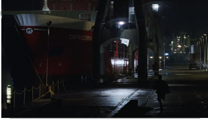
Görsel 2. Bruce, gemiye doğru koşuyor.

anti-kahraman kavramının temelini oluşturmalarıdır. Şayet Bruce'un yola çıkması ve çağrıya kulak vermesi, içindeki adaleti sağlama hırsının bir sonucudur. Böylelikle kahraman, gelenekselin zıttı olan anti-kahraman sunumuyla yoluna devam edecektir.