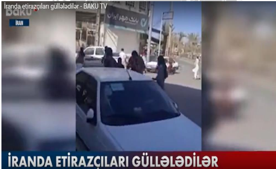
Fotoğraf 5: Bakü Televizyonu, 29.10.2022 Tarihli Haberin Görseli Kaynak: (Baku Televizyonu, 2022)