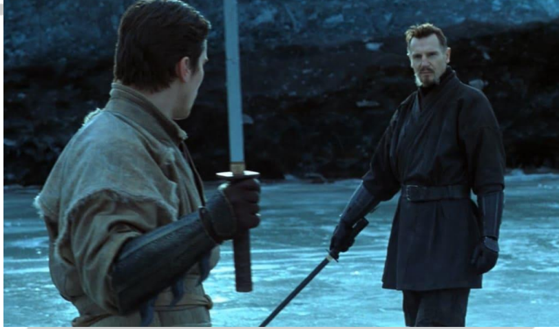
Görsel 3. Ducard, Bruce'u eğitiyor.

infazın Gotham şehrine yapılacağını öğrenir. Burada kahramanın erginleşebilmesi için gerekli olan önsezi ve bilinç, anti-kahraman Bruce'un bu intikam tablosunu reddetmesiyle aynı orantıda işlemektedir. Nitekim Bruce, çiftçiyi öldürmeyi reddederek Batman kimliğinin temelini inşa etmiş ve kendine münhasır bir adalet zırhı kuşanmıştır.