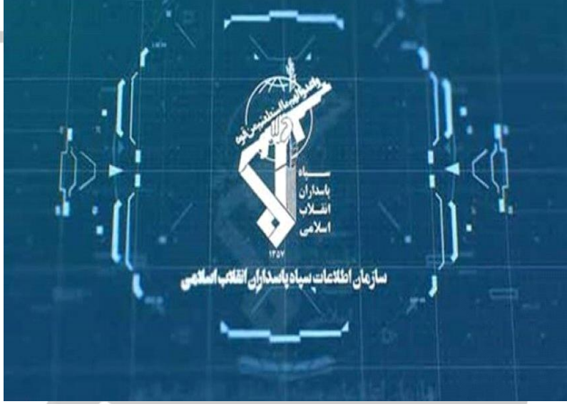
Fotoğraf 3: 29.10.2022 Tarihli Haberin Görseli

*CIA başta olmak üzere İran'ın düşmanları son günlerde ortaya çıkan ayaklanmaları desteklemektedir (Protestocuların eylemleri gayri meşru bir zemine taşınmıştır. Olumsuz bir olgu üzerinden örtük bir söylem örüntüsü ile eylemciler kısmen aktif edilmiştir).